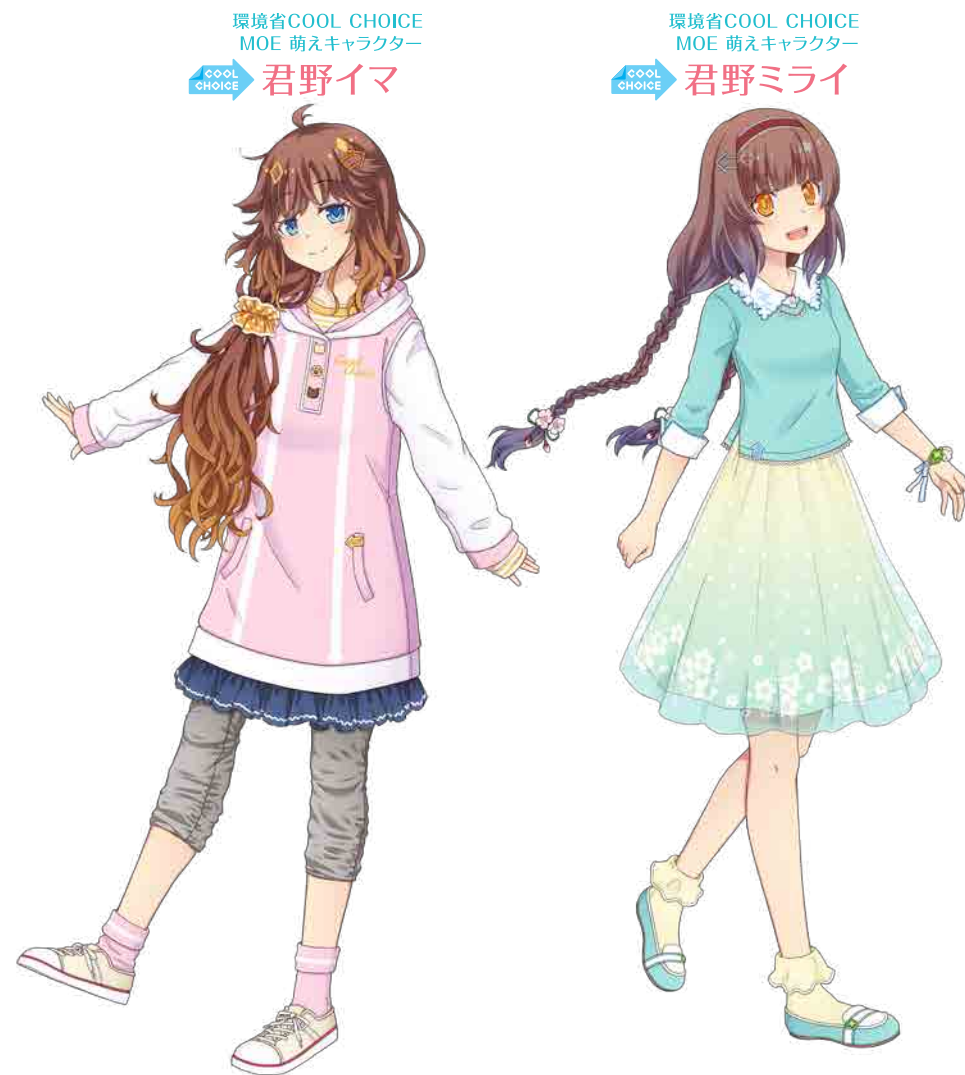
〈イメージキャラクター春服系（カラー）〉