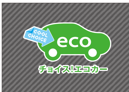
濃い色の写真やパターン