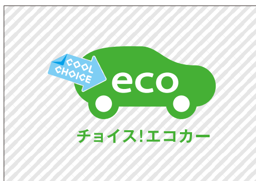
淡い色の写真やパターン