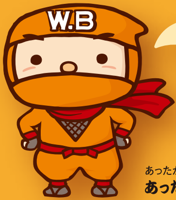
あつたか忍者 あつた丸