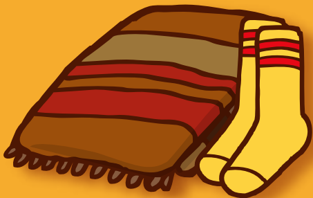
特に冷えやすい首まわりや 足もとをあたたためよう