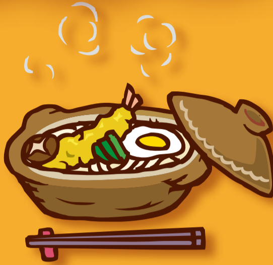
煮込み料理などを食べて 体をあたためよう