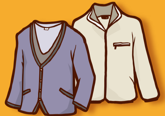
動きやすくあたたかい 室内着を活用しよう

WARMBIZ(ウォームビズ)とは、寒い季節でも暖房に頼り過ぎないで快適に過ごそうという取組。寒い時は一枚多く着る、温かいものを飲むなど、ちょっとした工夫で、20°C以下の室内で快適に過ごすことができます。地球温暖化対策のため、暖房時のエネルギー使用量とCO 2 発生量を削減して、地球に、みんなに、やさしい冬にしましょう。