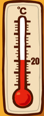
暖房時の室温は 20°C以下に