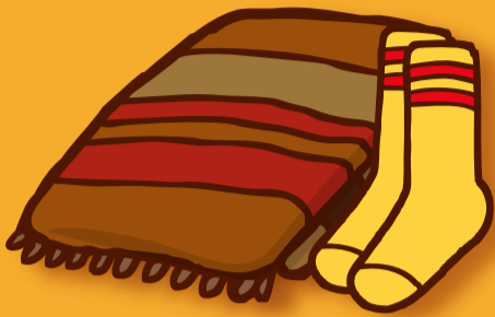
特に冷えやすい首まわりや 足もとをあたためよう