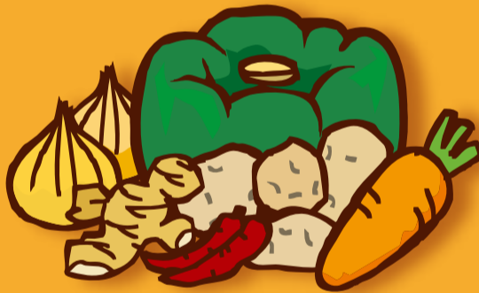
根菜や香辛料など、 体をあたためる食材をとろう