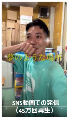
SNS動画での発信 (45万回再生)