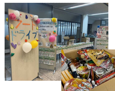
帝京平成大学の学園祭で実施した様子と 集まった食品（一部）

区内常設窓口のほか、区主催のイベントや区内大学・専門学校・企業と連携した特別受付も実施しています！