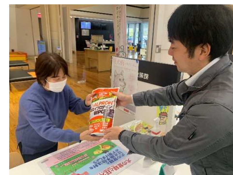
貯まったポイントで商品交換