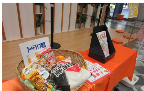
フードドライブ普及啓発イベント (R6.9.14コープこうべ西神南店)

兵庫県版デコ活「ひょうご1.5℃ライフスタイル」の一環として、県庁舎及び県内288※の協力店舗でフードドライブを実施しています。※R6.11月時点