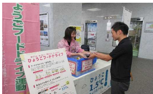
県各庁舎フードドライブを実施 全16回約1.5tの食品を回収・寄付