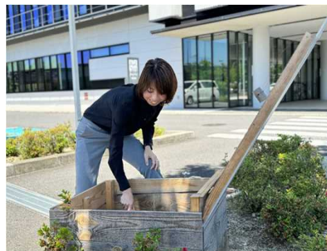
生ごみ減量の取組でSPOBYアプリのポイント獲得