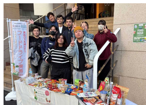
東京ビジネス外語カレッジの 国際交流イベントで実施した様子